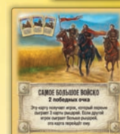
Самое большое войско