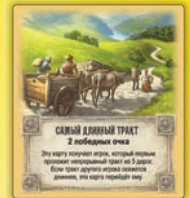
Самый длинный тракт