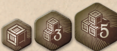
61 жетон ресурсів (номіналами «1», «3» та «5»)