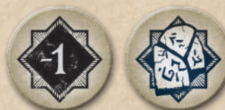
44 жетони хаосу

Далі наведено приклади компонентів гри для ознайомлення. Повний розбір карт наведено у довіднику (с. 28-31).