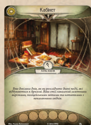
Карты локацій (закритих та відкритих)