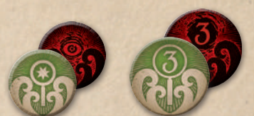
57 жетонів заціпок/приреченості (двобічні; номіналами «1» та «3»)