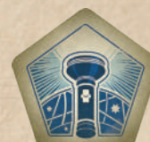
Маркер провідного дослідника