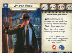
5 карт дослідників