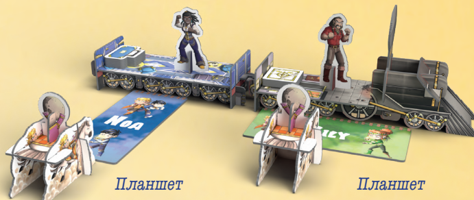
Планшет вертикально: складніша позиція

Перемістіть фігурку Сема. Подумайте, з якої позиції ви б хотіли стріляти (складнішої чи простішої) і скористайтеся своїм планшетом-пам'яткою, щоб розташувати Сема ближче до поїзда або далі від нього (див. малюнок нижче).