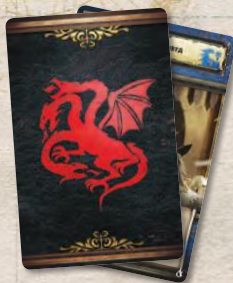
21 карта домов