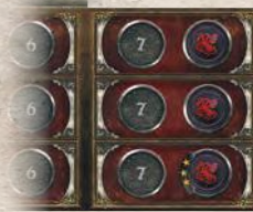
Пристройка к треку влияния

Разложите поле в центре стола. Как показано ниже, положите накладку Укуса и Орлиного Гнезда, а также пристройку к треку влияния.