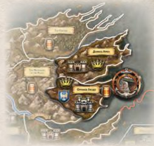
Накладка Орлиного Гнезда

Дом Таргариенов: если дом Таргариенов принимает участие в игре, положите дополнительное поле Эссоса справа от основного и выровняйте оба поля по нижнему краю. В противном случае уберите поле Эссоса в коробку.