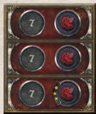
1 пристройка к треку влияния