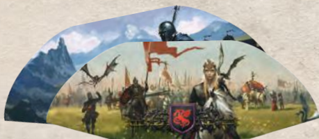
2 ширмы домов