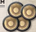
Один набор жетонов приказов вассалам

Положите принадлежащие вассалам жетоны победы рядом с треком Железного трона. Это МАРКЕРЫ ВАССАЛОВ . Затем возьмите наборы из 4 жетонов приказов вассалам по количеству домов вассалов (например, 2 набора, если в игре всего 2 вассала). Один такой набор получает игрок, занимающий первую позицию на треке Железного трона. Ещё один набор — игрок, занимающий следующую позицию, и так далее, пока не закончатся наборы.