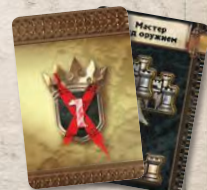
12 карт займов