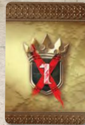
Рубашка карты займа

Не надейтесь, что ушлые банкиры из Браавоса простят вам долг. Получив займ, великий дом должен до конца игры платить ПРОЦЕНТ ПО ЗАЙМУ . В начале фазы Вестероса в порядке хода каждый игрок, имеющий займ, должен сбросить 1 доступный жетон власти за каждую полученную им карту займа. Если у игрока недостаточно жетонов власти на оплату процентов, то за каждый недостающий жетон власти игрок, владеющий Валирийским мечом, выбирает один из отрядов этого игрока в любом месте на поле и уничтожает его. Если игрок, неспособный оплатить процент, и есть владелец Валирийского клинка, то выбор за него делает игрок, занимающий следующую по очерёдности позицию на треке вотчин.