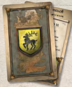
7 карт подготовки вассалов