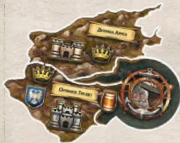
1 накладка Орлиного Гнезда