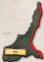
1 накладка Укуса