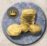
Жетон приказа Железного банка

Железный банк предоставляет займы лордам Вестероса. Благодаря этому вы сможете получить дополнительные отряды или помощь иного рода. Разыграв особый жетон приказа Железного банка (см. «Морские жетоны приказов» на стр. 10), вы можете взять один займ.