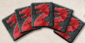
5 жетонов силы драконов