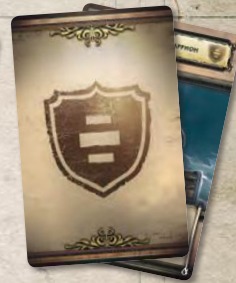
7 карт вассалов