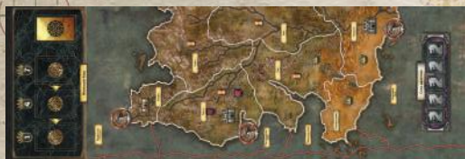
1 дополнительное поле Эссоса