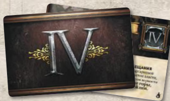
10 карт Вестероса (колода IV)